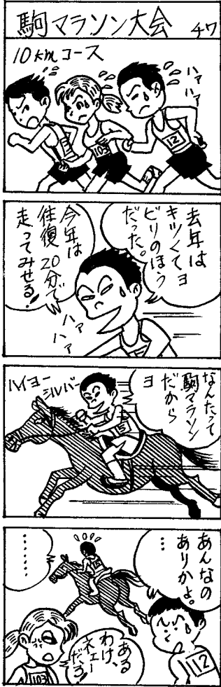
協力：のびのびマンガ教室（十和田）

今年も全国各地の流鏝馬（やぶさめ）競技上位入賞者が一堂に集い、日本一を決定する「流鏝馬選手権」をはじめ、ちびっこ乗馬ショーや障害飛越のデモンストラーション・木馬速射競技など、馬にこだわったイベント盛りだくさんで皆様をお待ちしています。 《開催日》10月15日（土）・16日（日） 《場所》市中央公園緑地