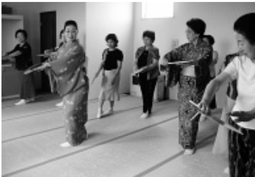
熱心に指導を受ける女性会メンバー

去る8月25日、会員10名の参加で会員親睦の昼食会と軽スポーツ教室が行われました。