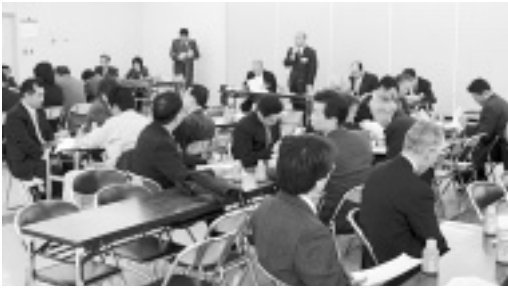
3月6日に開催された合同部会。写真は建設部会

このような状況を脱するため「行動し信頼される商工会議所」として活気溢れる商工業の創出と住み良い安心できるまちづくりに向