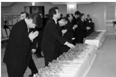
献花を手向け、遺影に向い最後の別れをする参列者