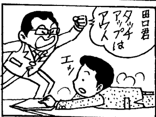
協力：のびのびマンガ教室（十和田）

《Bコース》ファミリコー ース(14km)バスで取水口 まで/9時30分ウォークス タート・稲生川沿い/稲生 川遊歩道/官庁街通り(駒 街道)太素塚