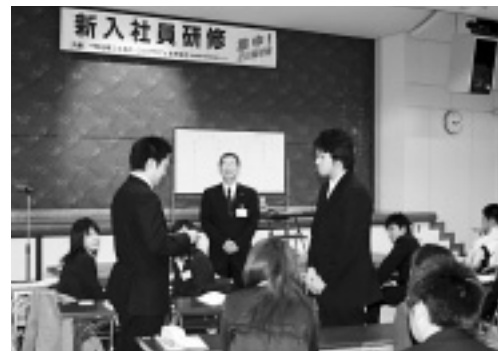
緊張した面持ちで名刺の受け渡しを練習する参加者

市内17事業所へ採用された新入社員を対象に3月22・23日の2日間、当所相談所とジョブカフェあおもりの共催で新入社員研修を開催した。講師はMACS研究所長の横井孝司氏。32名の参加者は、2日間で新入社員としての心構え、接客・電話対応の基本から表現力・コミュニケーション力など、社会人としての基本を身に付けようと真剣に学んでいた。