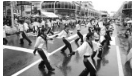
昨年「中心市街地にぎわい特区」を活用し、開催されたよさこい夢まつり

当商工会議所は、役員一人ひとりの意識向上を図りながら、組織強化と組織率の向上に努め、地域総合