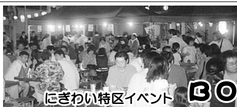
にぎわい特区イベント