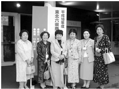
六県連総会に参加した女性会メンバー

当女性会は6月20日、会長始め会員6名が「杜の都仙台」に大きな期待を持って旅立ちました。