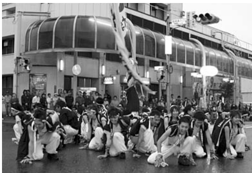
躍動感ある踊りを披露した「北里三源色」