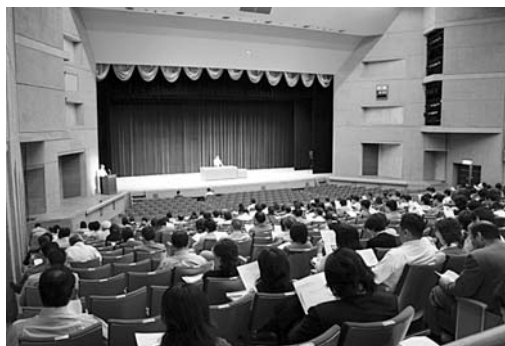
市内及び近隣の市町村から約250名が参加した電子入札システム説明会