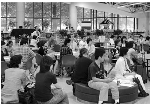
北里大学の学生ホールで行われた歓迎レセプション