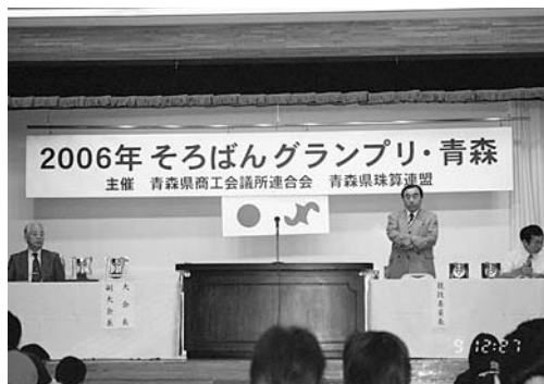
壇上から緊張感が漂う大会会場

青森県商工会議所連合会主催の「2006そろばんグランプリ・青森」が7月9日、青森県教育会館で開催された。当日は、県内各地から108人の参加者が、「小学生4・5・6年の部」「学校の部(中・高校生)」「一般の部」で日頃の成果を競った。結果は、個人及び団体競技で1つの部門を除き管内の参加者が1位を独占。会議所対抗では、十和田商工会議所が昨年延续了1位に輝いた。