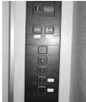
点字シール付としたエレベーターボタン