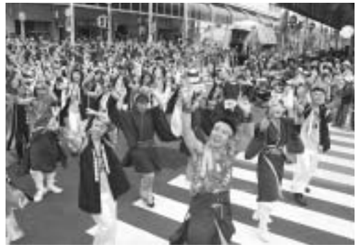
今年から2日間開催となり、55000人の入出を数えた2006とわだYosakoi 夢まつり

その様な背景もあり、我々青年部も設立以来、観光推進事業を取組むべき最重要事業の1つとして掲げてきた。平成13年迄の長きに亘り継続した「駒っこ広場夏まつり」も地域住民に愛され、果たしてきた使命は余りある。そして平成14年にコンサルの指導を受け、「体験型ツアー企画委員会」を立ち上げた。地域経済の振興に寄与するという活動目的のもと、滞在型観光地へ脱皮していくための起爆剤的かつ先導的役割を担う事業を模索。素材探し、組織作り、事業化の可能性などなど、紆余曲折を経て