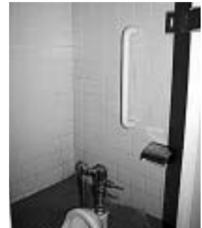
1階の男女トイレの個室すべてに設置した手すり