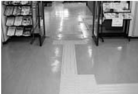
エレベーターを2階で降りると当所事務所まで設置した誘導ブロック