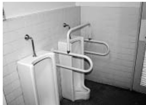
1階男子トイレ(1ヶ所)に設置の手すり