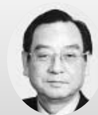
内閣総理大臣表彰 交通安全功勞