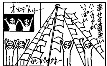
協力:のびのびマンガ教室(十和田)