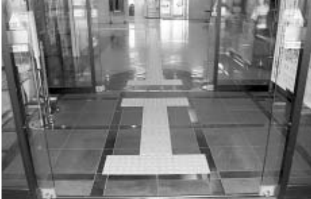
正面玄関からエレベーターまで続く誘導ブロック

障害のある人が社会生活をしていく上で障壁（バリア）となるものを取り除いていくことを「バリアフリー」と呼んでいます。