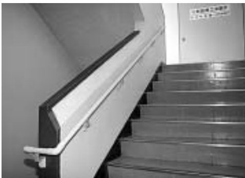
1階から2階までの階段に手すりを設置