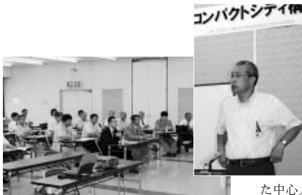
青年部メンバーや商店街関係者ら約40名が参加した