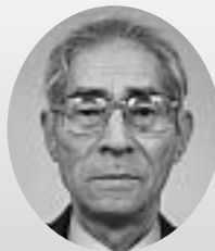
瑞宝単光章 職業訓練功勞