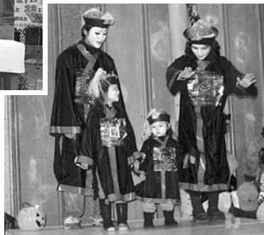
▶七八丁目商店街のハロウィンコンテスト。思い思いの衣装とパフォーマンスで盛り上がった