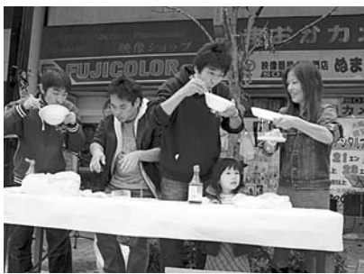
▲中央商店街での長い朝食選手権の一幕