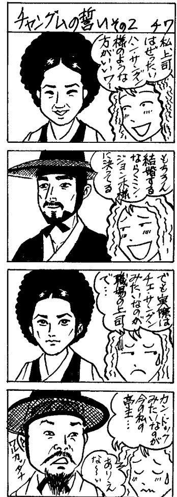
協力:のびのびマンガ教室(十和田)