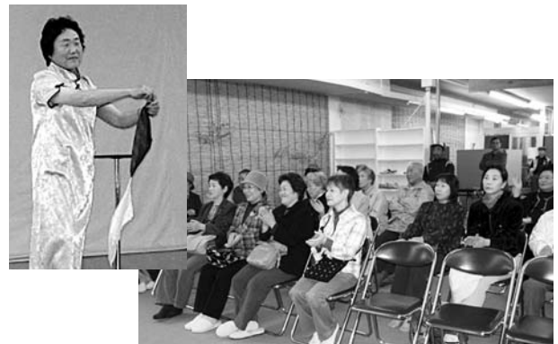
次々と繰り出されるマジックに盛り上がる会場

自動ドアとユニバーサルデザインに配慮した多目的トイレの工事を終えた市民ふれあいホールが10月22日、装いも新たにリフレッシュオープンした。ホール内には、ワンボックスショップや畳を敷いたくつろぎの場が新たに設けられた。またオープンを記念し、ホール前ではジャズコンサート、ステージでマジックショーや花柳流美好楽会の舞踊などが行われ、来場者から盛んな拍手が送られていた。