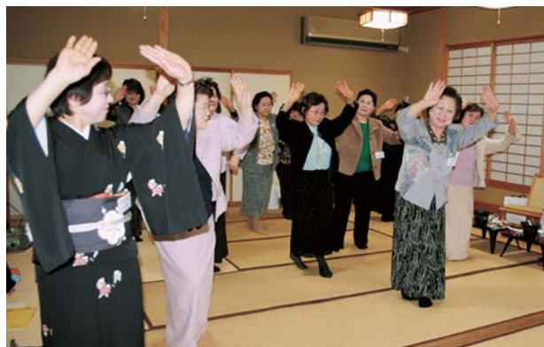
1月24日に開催された新年懇談会。写真は、11月例会で講習した「月がとっても青いから」の踊り

行事をするためには、そこに至るまでの行経の苦労が大変だと思えますが、出来るだけ参加して皆様