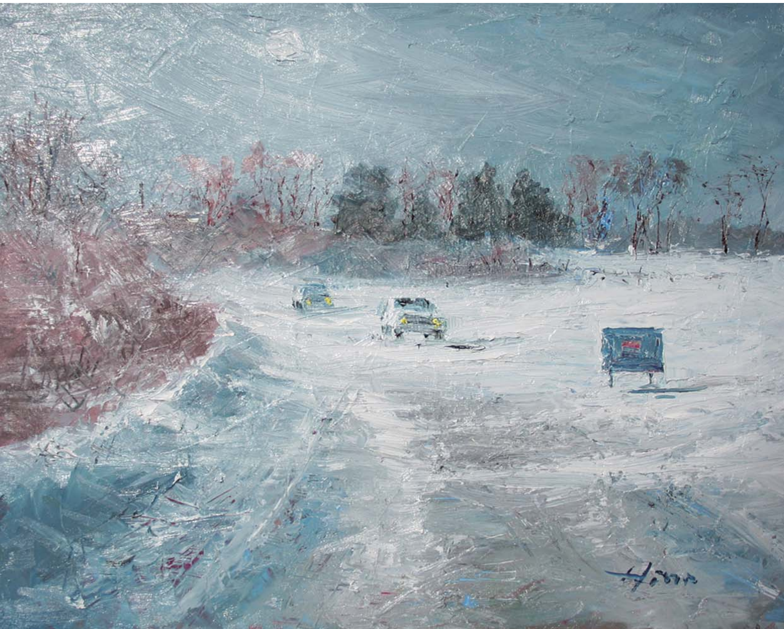
三農高付近の自然が見せる一瞬の表情! 凶暴でいながら男らしく美しい!