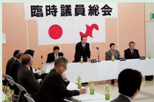
新年、最初の総会とあって出席議員は40名を超えた