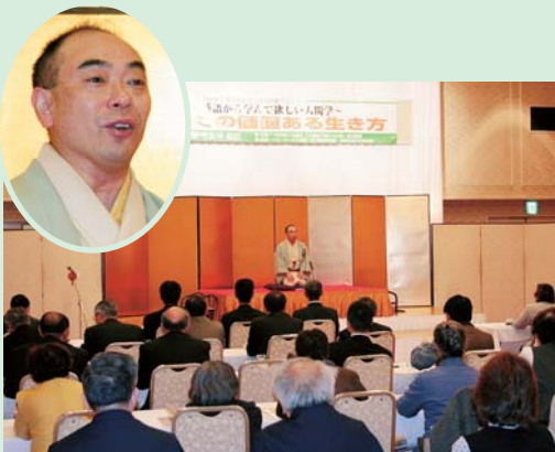
江戸時代から続く落語を通じて、技術継承の大切さを話す林家うん平師匠