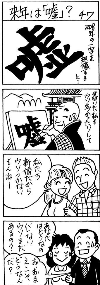
協力: のびのびマンガ教室(十和田)

『『若者』『よそ者』『ばか者』が地域を変える』と言われるが、様々な意味で他の選手、力士とは違う福士、朝青龍の二人には、これからも陸上界、大相撲界の「ばか者」であってほしい。(K)