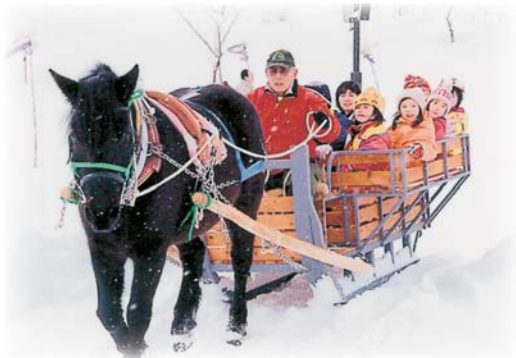
馬そりに乗って駒っこランド 周辺をゆっくりと進む。 (雪国馬そりツアー)

市内のイベントを列記してみました。雪を味方に付けて、冬を楽しむ発想を持ち、「ディスカバー冬の十和田」と洒落てみませんか？「冬こそ十和田市」が見えてくるかもしれません。