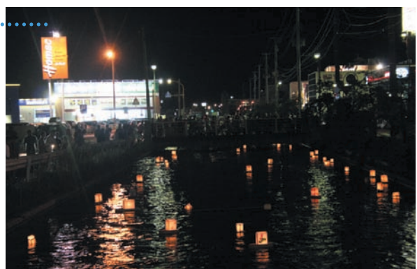
それぞれの想いを込めた灯ろうが稲生川の水面に幻想的な光景を醸し出した

8月16日、36年の時を経て灯ろう流しが復活した。今年は稲生川上水150周年の節目の年であるということもあり、着々と進められてきたこの計画。当日は太素塚境内に約190人の市民が集合。会場である稲生川までの道のりを練り歩き、開会セレモニーのあと、先祖供養や家内安全など様々な願いを込めた灯ろうを川へと流した。会場に集まった約3000人の観衆は、灯ろうの放つ幻想的な灯りを見つめ感慨にひたっていた。灯ろう流しは今回の開催を機に、課題を改善しながら来年以降も開催していく予定。