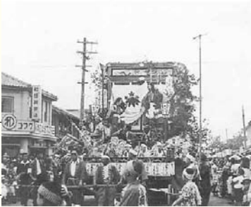
〈昭和30年代後半の秋まつり〉