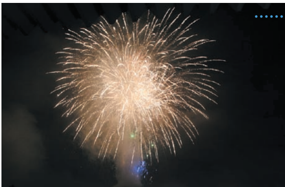
雨が心配されたが、煙などの影響もなく彩鮮やかな花火を観覧することができた