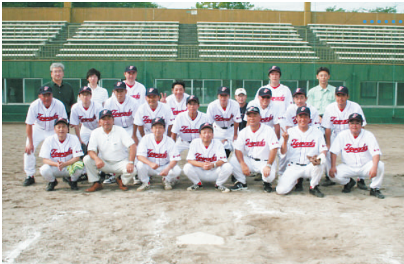
監督の石川会頭を中央に2連覇を飾った当所メンバー