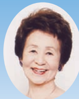
特別ゲスト 菅原 都々子

とき 平成20年 10月12日(日) 開場/9:30 準決勝/10:00 決勝/13:30