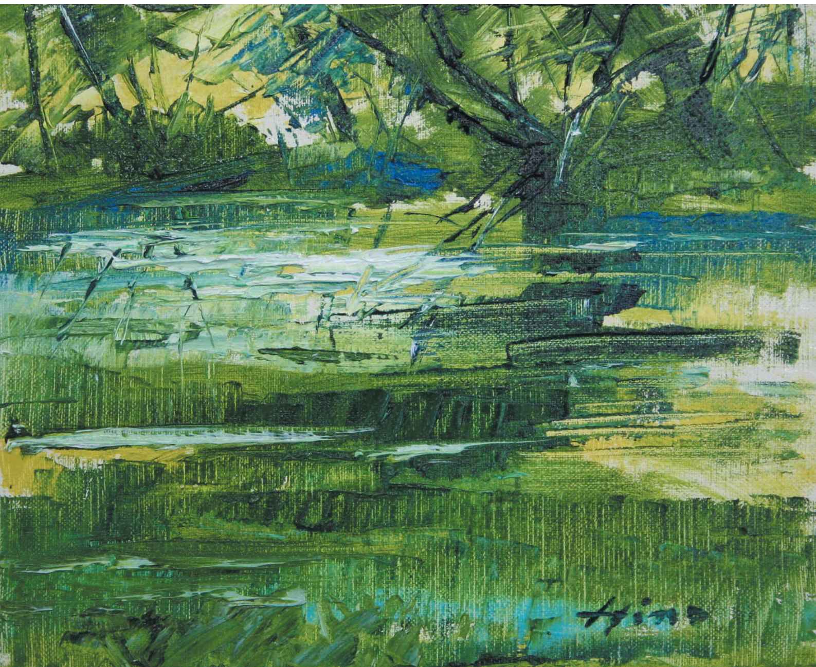
十和田八幡平国立公園の中でも特に神秘的なたたずまいの葛沼周辺には、真珠の首飾りのような小さな沼が連なる。中でも「鏡沼」は天候によって変幻自在な輝きを見せ、期待を裏切らない。

明るく、楽しく学ぶ「接客セミナー」の受講者を募集 9月8日 第2回「月がとっても青いから」全国カラオケコンクールの入場券販売中