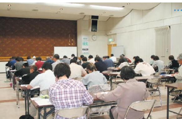
試験に集中する受験者ら。勉強の成果は発揮できたろうか。