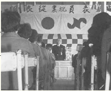
〈優良従業員表彰式〉