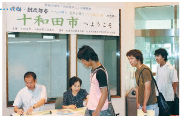
少し緊張した面持ちで受付にやってきた学生たち

来春から十和田キャンパスでの新生活がスタートする北里大学生をサポートする目的で、8月1日と2日、9日、10日の4日間にわたり、北里大学生受入れ支援事業が実施された。当事業は十和田市と当所が主催し、北里大学獣医学部と同学部同窓会紅緑会の協賛のもと、今年で6回目を数える。今回は、アパート探しで市内を巡回する際に利用するタクシーの料金の一部助成と、先輩学生による学生生活の相談会を行い、学生らは新たな地で始まるキャンパスライフに心躍らせていた。