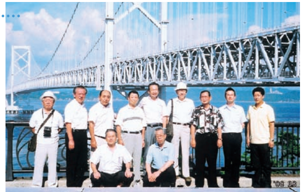
鳴門海峡を結ぶつり橋・大鳴門橋をバックに

8月9日から11日までの2泊3日の日程で議員研修が行われ、今年度は徳島県の阿波おどりと高知県のよさこい祭りを視察した。初日の阿波おどりは日程の都合上、祭典本番を視察することができなかつたため、1年を通じて阿波おどりを体験することができる「阿波おどり会館」を約れ、そこで行われている本番さながらの阿波おどりの実演を観覧した。2日目はよさこい祭りを視察し、191団体、総勢約1万9千人による本場高知のよさこい演舞の大迫力を肌で感じた。