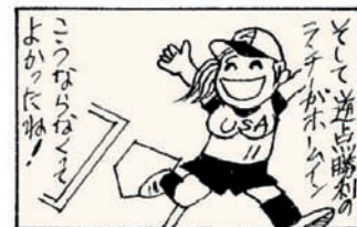
協力:のびのびマンガ教室(十和田)