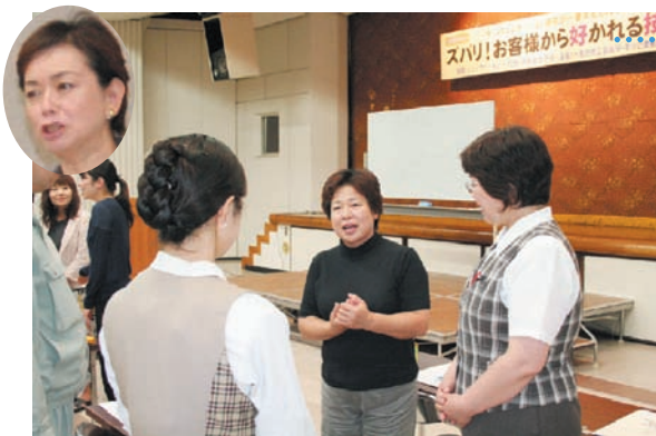
隣の人を紹介するというトレーニング。簡単そうでもなかなか難しい様子。