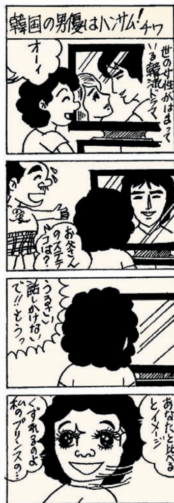
協力:のびのびマンガ教室(十和田)

毎週火曜日 当所2階 午後1時～4時 青森県弁護士会 十和田法律相談センター 相談申込先(事前予約) TEL 017-777-7285 青森県弁護士会