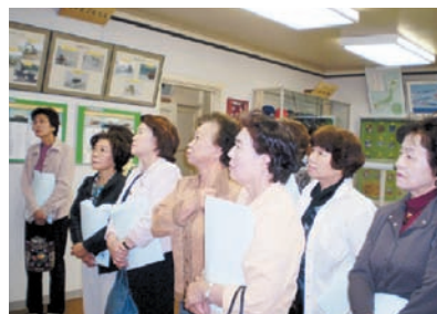
真剣な面持ちで説明を聞き入る女性会メンバー