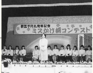
ミスかけ橋コンテスト