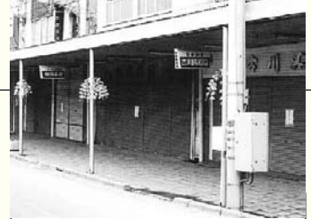
商店街は一斉閉店