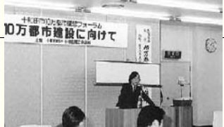
10万都市構想フォーラム