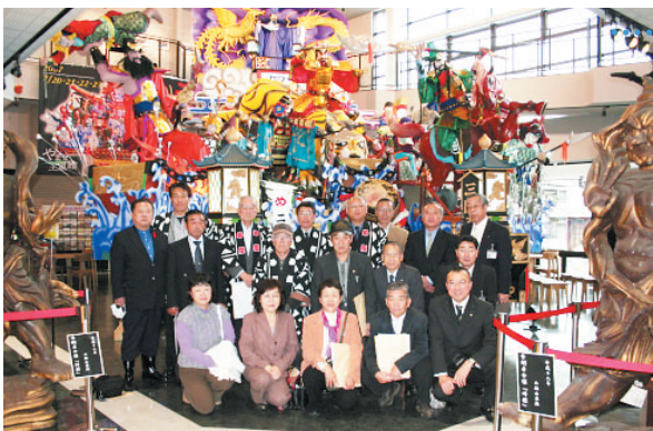
やませ土風館に展示されている久慈秋まつりの山車をバックに記念撮影。