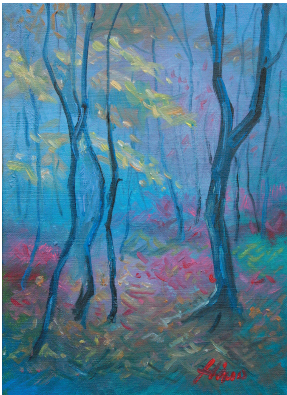
八甲田の手前、牛の背中のようにうねる黒森は茸山としてもよく知られる山である。 むらさきしめじを採った辺りの晩秋の林中はしずかで美しい。

健康とわだ21フォーラムは11月16日 都市計画特別用途地区の指定に関する住民説明会は11月7日・9日