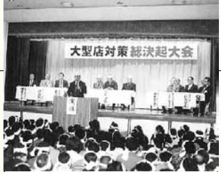
大型店対策「総決起大会」