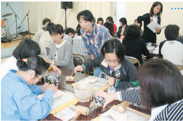
先生の指導のもと熱心に取り組む参加者。 写真はレザークラフト講座の様子。