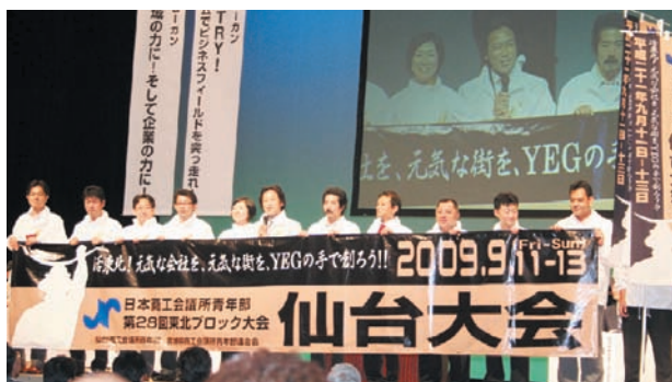
次年度の東北ブロック大会は宮城県仙台市で行われる。会場では仙台YEGメンバーが開催地をPR。