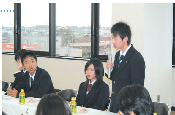
就職担当者に質問する生徒。忌憚のない活発な意見交換が行われた。

十和田地区雇用対策協議会では長引く不況で雇用情勢の低迷する中、新規高卒者の求人・就職活動の支援策として、10月7日、卒業後就職を希望する市内の高校2年生を招いて、「会員事業所と生徒との懇談会」を開催した。会で生徒は「どんな人を会社は採用するのか?」「高卒ではできる仕事に限られてしまうのか?」などといった疑問や不安を感じていることを企業の就職担当者に質問し、意見を仰いだ。生徒らは就職担当者の話をメモにとるなどし、今後の就職活動に向けて決意を新たにした。