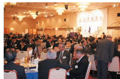
←新年を祝い、あいさつを交し合っていた。