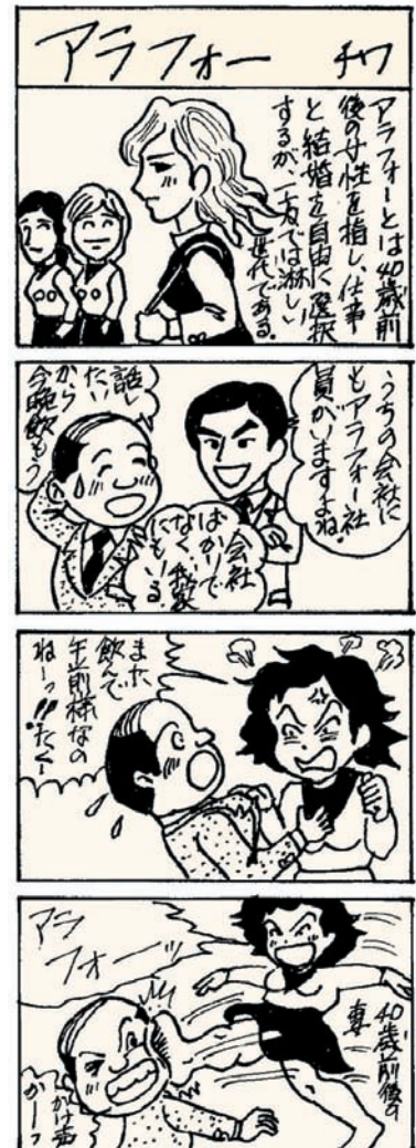
協力: のびのびマンガ教室(十和田)