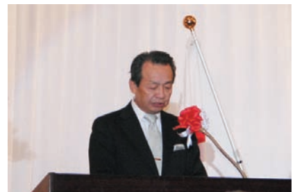
石川会頭。年頭のあいさつをする