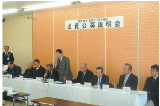
(仮称) (株)まちづくり十和田設立発起人会の発起人9名