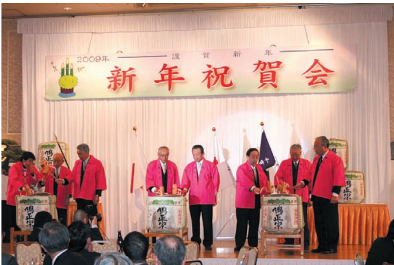
鏡開きで祝宴はスタート。今年は一体どんな年になるのだろうか。

異変に揺れた平成20年。平成21年はいかなる年にしようか、出席者は新年の門出を祝うとともに、今年1年の健闘を誓い合った。