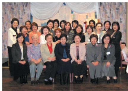
懇談会参加者で記念撮影