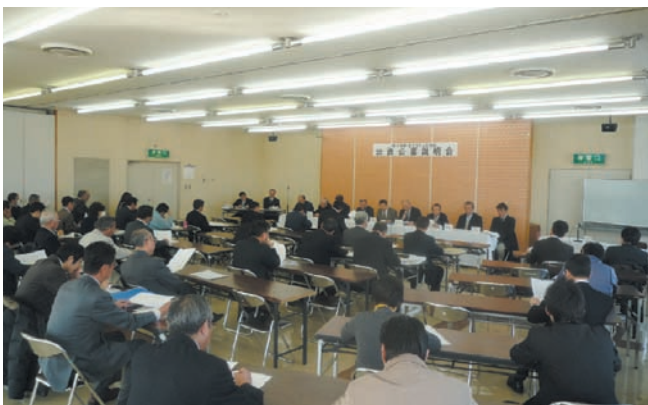
出資公募説明会には、60名を超える方々が参加した