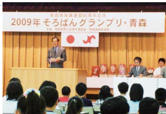
注意事項を真剣に聴く選手たち