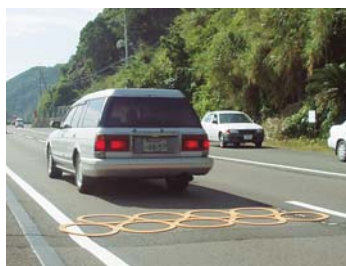
↑ピタリング設置状況 高知県幡多郡黒潮町(国道56号)

とはいうものの、相手は“工業製品”という建設業とは分野の異なる“異業種”であり、開発・