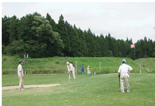
晴天の下、はつらつとプレーする参加者