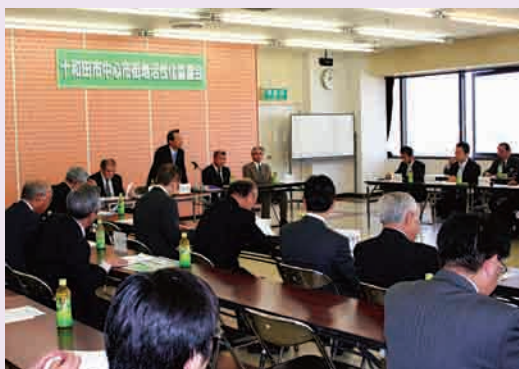
総会に先立ち、石川会長があいさつ