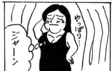
協力: のびのびマンガ教室(十和田)