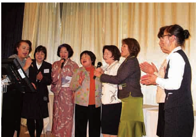
懇親会ではカラオケなどを楽しみ、終始和やかムード