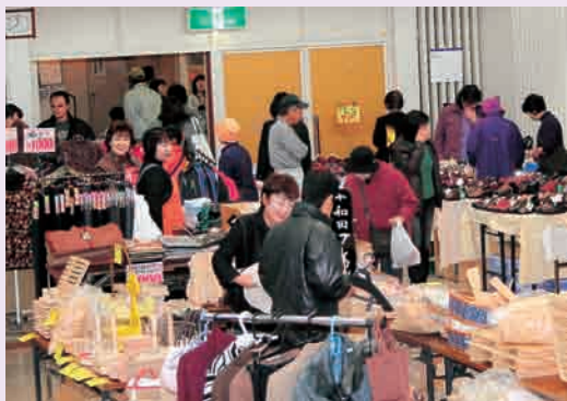
大売出し連盟主催の商業まつり (写真=平成21年度の様子)

当所大売出し連盟では、5月14日、定時総会を開催し、平成21年度の事業及び収支決算について報告し、平成22年度の事業計画と予算について審議した。平成22年度の事業計画に関しては、少ない予算の中でも商店街連合会等と連携を図り、十和田市が盛り上がっていくような事業を計画し、実施していきたいと話合った。