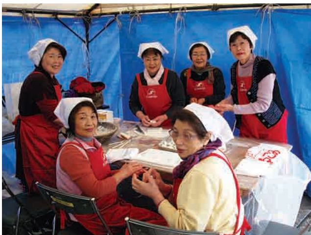
愛情とおもてなしの心をこめて、だんごづくり!