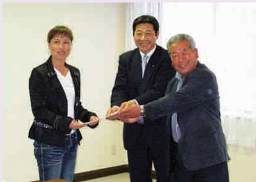
新山社長と櫻田専務理事より修了証書を授与される研修生