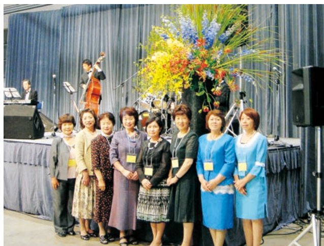
当所女性会からは8名が出席

改めて家庭も地域も女性が元気でなければ!!と感じさせられ、女性のパワーこそが人づくり、街づくりに大きく関わるんだなあと思いました。私ももっともって頑張らなければならないと思い、そのパワーを頂いて帰ってまいりました。