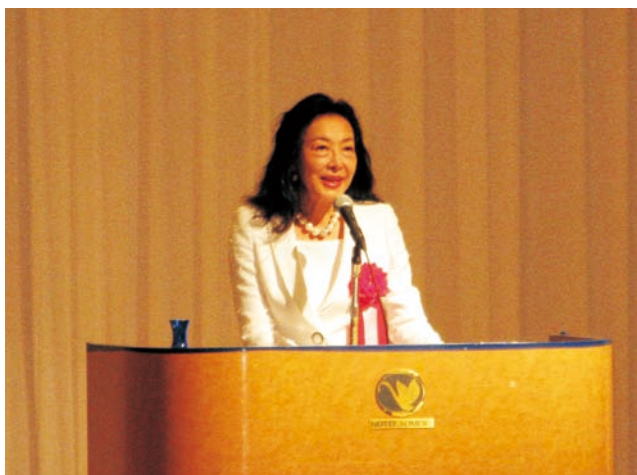
環境問題と私たちの暮らしについて解説する見城講師

総会では、平成21年度の事業報告や収支決算など、案件はすべて承認され、平成22年度の事業計画については、「特に早期景気回復の実現を最優