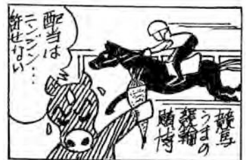
協力: のびのびマンガ教室(十和田)