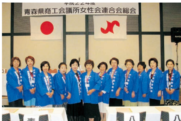
総会には揃いの半纏で出席