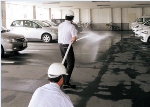
実際に放水を行った消火訓練

当所では7月12日、十和田消防署の協力のもと、当会館内勤務者全員参加の消防訓練を行った。今回は1階ホールからの火災を想定。発見から避難退去まで総合的な訓練を行い、参加者は通報連絡や消火、避難誘導など各班に分かれて、消防隊員の指導を受けながら迅速な行動をとっていた。