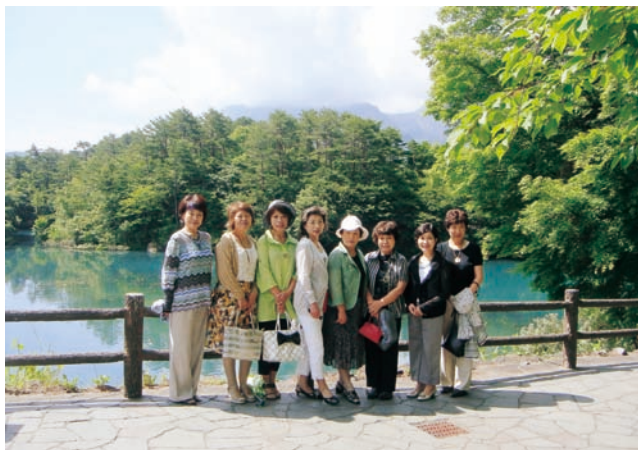
きれいな色の五色沼!!

開催県である福島県商工会議所女性会連合会の皆様、並びに開催地の郡山商工会議所女性会の皆様方の心あたたまるおもてなしと、女性ならではの気配りに、感謝の気持ちでいっぱいでした。