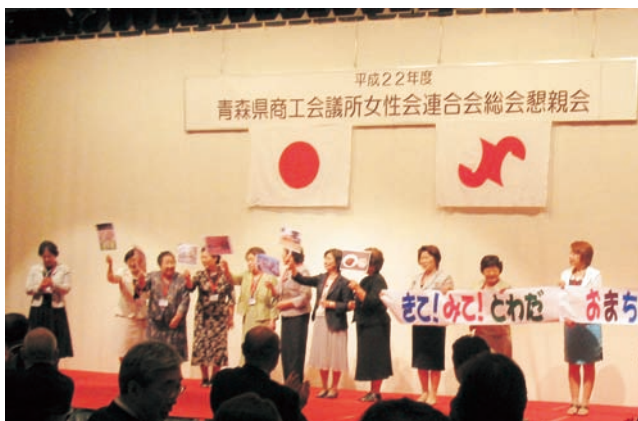
手作りのうちわと横断幕でPR。来年の会場は十和田！