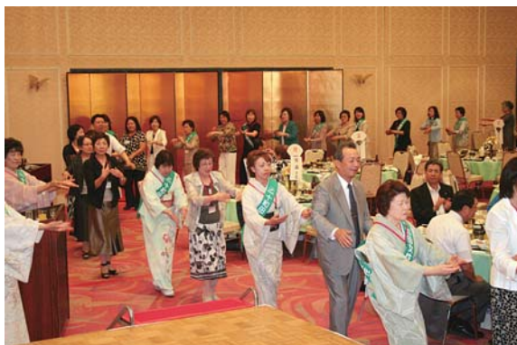
最後は全員で三本木小唄の流し踊り