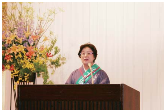
懇親会に先立って会長のあいさつ