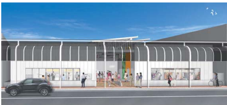
アーケード側外観