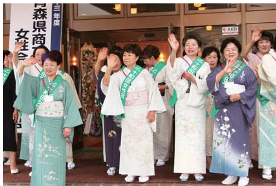
お見送りの笑顔で

問4. 東道旌表碑は、ある戦争を見据えての弘前第31連隊の耐寒訓練案内人を務めた、柏地区青年7人の功績を称えて建てられた石碑であるが、その戦争とは？