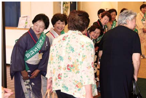
来場者を笑顔でお出迎え

会員の皆様、今回ご協力をいただいた皆様、本当にありがとうございます。そして、ご苦労さまでございました。