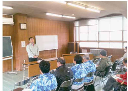
神戸の商店街復興を学んだ復興支援講演会