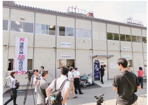
複数店舗が入居しオープンした仮設店舗