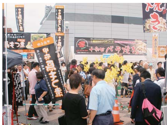
多くの来場者で賑わう会場