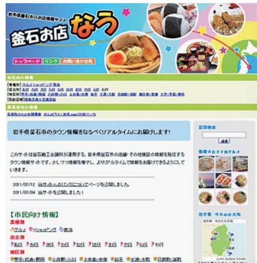
「釜石お店なう」HPのトップページ