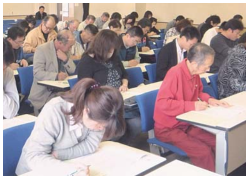
検定に臨む受験者

今回の検定は少々難易度が高かったようで、10月28日の合格発表の結果、合格者31名、合格率49.2%だった。