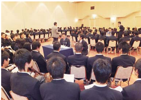
トークサロンの様子