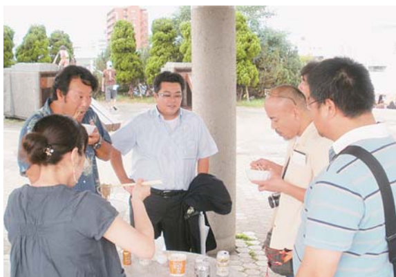
B級ご当地グルメを食べ比べ

今回は会員同士・新規入会予定の方との交流の場として、十和田市のPRのためYEGからも多く出向している十和田バラ焼きゼミナールを応援して仲間同士の絆を深めようという目的で、例会をレクリ