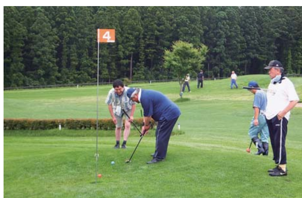
プレーを楽しむ選手達