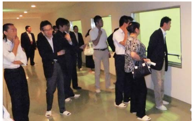
工場施設内を見学するメンバー

例会では、十和田バラ焼きの勝負タレ「ベルサイユの薔華ったれ」の製造工場でもあります株式会社ワダカン様のご協力のもと、工場見学を行って製造過程を勉強し、懇親会では、十和田バラ焼きゼミナールメン