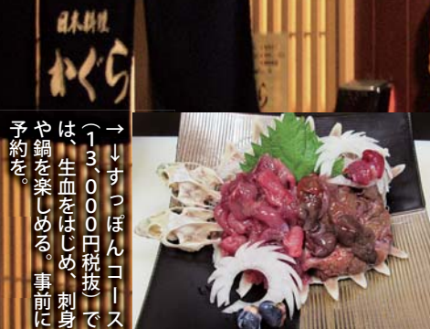
→↓すっぽんコース（13,000円税抜）では、生血をはじめ、刺身や鍋を楽しめる。事前に予約を。