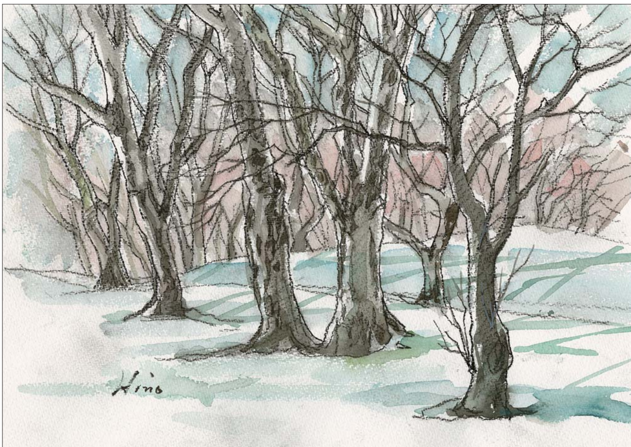
十和田市のどまん中に樹齢150年を越す槻(つき)の林がある。 野球場の南側に冬木となっても堂々たる姿を見せている。 光点となりて冬芽の雫かな 晃