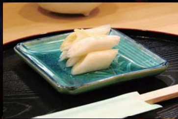
↑市産ネギ「ぼけしらず」の漬物

市内でも珍しい“すっぽん”料理が味わえる店「日本料理かぐら」。日本の食文化を基調に、地元の食材と地元ではなかなか味わえない食材を融合した、新しくもどこか馴染みのある深い味わいを楽しむことができる。和の薫る落ち着いた空間で、旬と産地にこだわった日本料理を堪能し、是非、至極のひと時を過ごしてほしい。