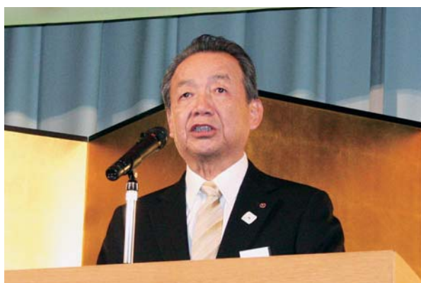
新年の挨拶をする石川会頭