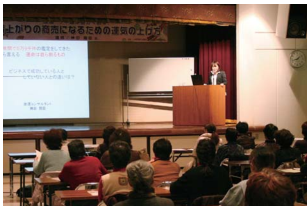
多くの方が参加し、講演を傾聴