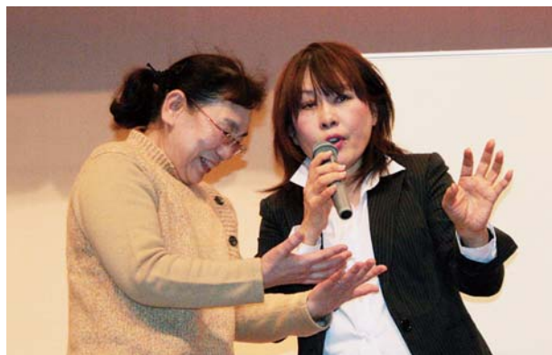
講師直々の手相診断

最後は特別に、参加者の中から2名の方の手相診断もしていただき、商売運がある、まだまだ仕事ができるなどアドバイスを受けていました。自分で出来る金運線の入力方など楽しい講演会でした。