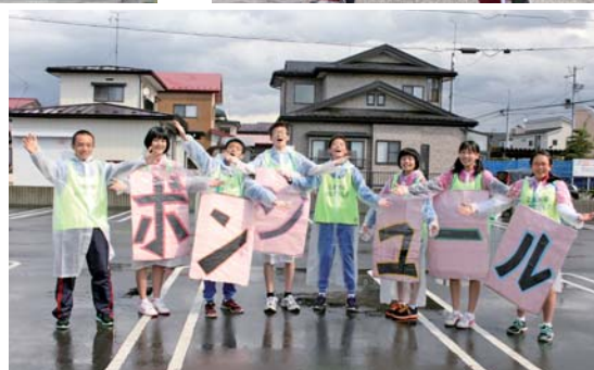
↑シャトルバスでの来場者を大きい声でおもてなし「ボンジュール!!」