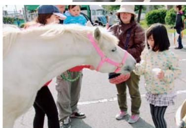
↑アオ*コレ体験コーナーでポニーにエサやり体験する様子