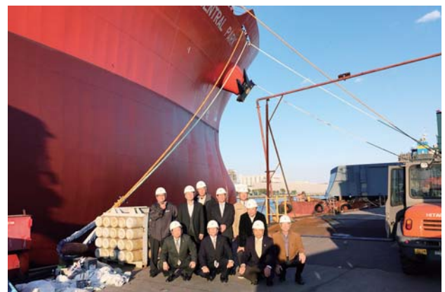
納品直前のケミカルタンカーをバックに

また、北日本造船㈱では、納品直前のケミカルタンカーやドック内の作業現場等を視察。船体は元より施設や機材等の規模の大きさに一同驚いた様子だった。