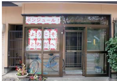
↑会場近くの民家もおもてなし