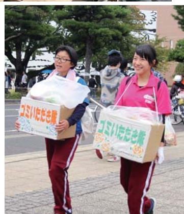
→清掃活動をする「ゴミいただき隊」