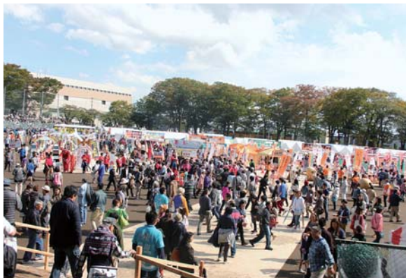
←たくさんの人で賑わう会場の様子