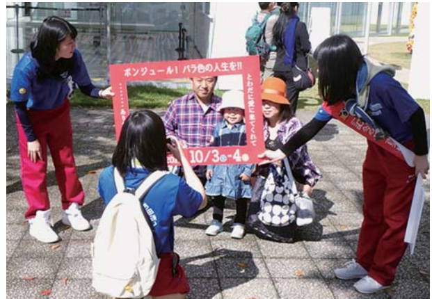
来場者に記念写真でおもてなし

今回のYEG事業が、B-1 グランプリの趣旨である「まちおこし」「地域愛」の一助になったのではないかと思います。今回大変忙しい中、この事業に知恵を出し協力してくれた研修委員会メンバーに感謝しつつ、事業の報告といたします、ありがとうございました。