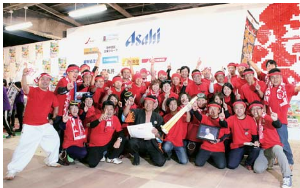
←ゴールドグランプリを受賞した「熱血!!勝浦タンタンメン船団」のみなさん