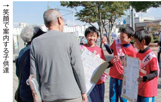
→笑顔で案内する子供達