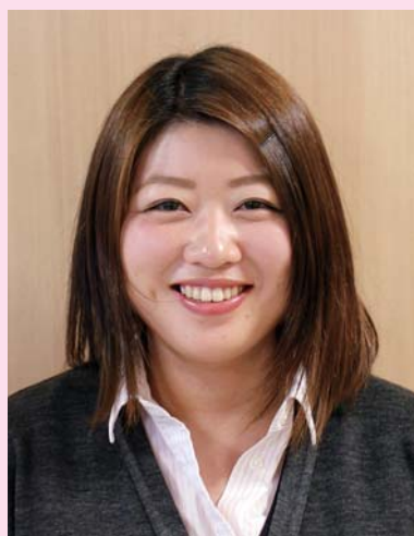
十和田温泉 (丸井商事株式会社)

また、よくいらっしゃる方だと、機嫌や様子を窺うことができるようになってきたので、その時々に合わせて対応の仕方も工夫しています。