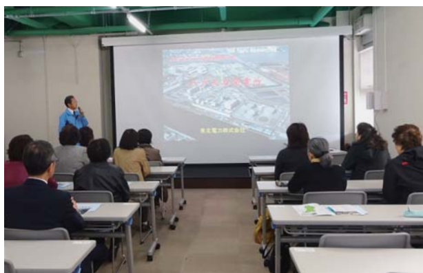
説明を聞き、エネルギーの大切さを再認識

八戸市水産科学館マリエントで休憩し、その後、先日全焼した蕪嶋神社に立ち寄って焼けた神社の下で拝礼し、一日も早い再建を参加者全員で祈って参りました。最後に訪れた帆風美術館は、原寸で再現された国宝や重文などの名品を身近に鑑賞できる日本初のデジ