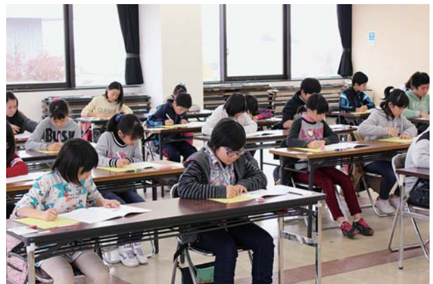
合格目指し問題に挑戦する受検者たち

70点以上（100点満点）で合格となるが、11月20日の合格発表では、22人が合格。合格者には合格証書が発行された。