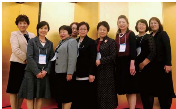
ANAクラウンプラザホテル金沢の懇親会場にて

22日の懇親会は3つの会場に分かれて行われ、アトラクションで披露された金沢芸妓素囃子は市無形文化財に指定されており、とても華やかでした。ちなみに、素囃子とは長唄、常盤津、清元などの邦楽や舞踊から囃子のみが独立した謡や舞の入らない演奏形式をいうそうです。次に披露された御陣乗太鼓は、太鼓のリズムや身振り身のこなし等が醸し出す異様な雰囲気独特の迫力を感じて来ました。