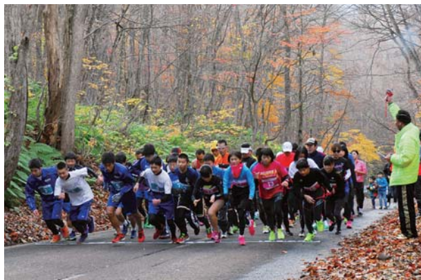
勢いよくスタート!!

去る11月1日(日)に当青年部と十和田湖商工会青年部の共同主催にて「十和田湖マラソンプレ大会」(十和田湖休屋)を開催致しました。当日は、天候も良くマラソン日和となりました。参加ランナーは56名。十和田湖休屋「とわだこ山荘」から約400mの地点をスタートし、瞰湖台を通り宇樽部キャンプ場付近までのアップダウンのコース5kmを全員が完走致しました。