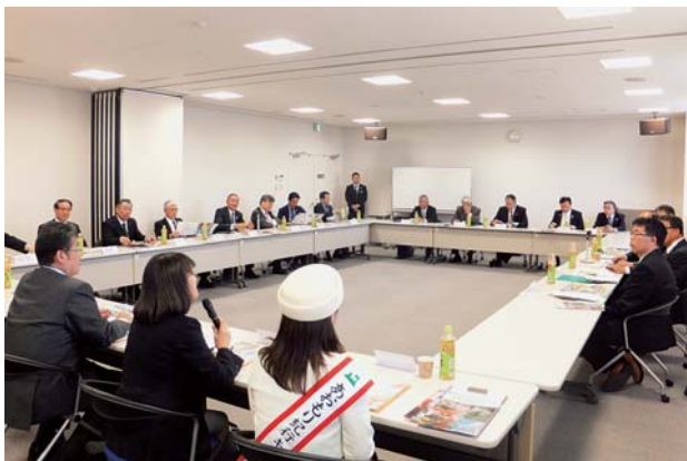
滋賀県商工会議所連合会との懇談会に臨むミッション団