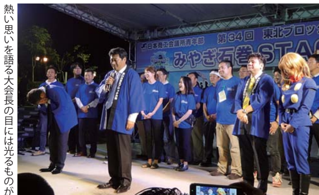
熱い思いを語る大会長の目には光るものが

石巻YEGの皆さんは、この東北ブロック大会成功に向け、何年も前から日本YEGに何人も出向し、昨年より東北の全単会にキャラバンし気合いの入りが違うなど感じていました。十和田にも大会前の忙しい中、7月の例会にPRに来てくれました。大会では石巻で喜んで貰おうと大会前夜からの食事の店の手配を単会毎にしてくれるなど様々な所まで気を配って貰いました。大懇親会の最後に大会長が涙を見せながら、東日本大震災でのご恩を返したいと言う思いで大会を創ってきたことを聴き、その思いがとても感じられる素晴らしい大会でした。