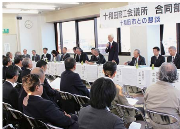
小山田市長はじめ市の担当部課長が出席して開催された合同部会

重点要望事項及び新規要望事項、また、継続要望事項のうち進捗の見られた事項について、回答の概要は下記の通り。詳細については、ホームページ ( http://www.towada.or.jp/ ) をご覧ください。