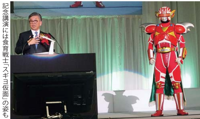
記念講演には「食育戦士」スギヨ仮面の姿も

大会中は雨も降らず、参加した9名で石川県の様々な伝統・文化に触れ、会員相互の連携がより一層深まる大会となりました。