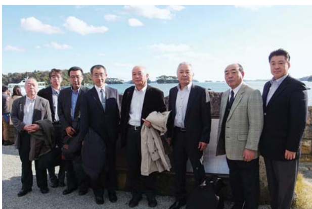
美しい景色が広がる松島