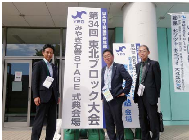
記念式典が開催された石巻専修大学

そして各県代表のYEG事業審査会であるマンガタンMaki2AWARDが行われ、青森県代表の弘前YEGが鍛冶町活性化計画で見事グランプリに輝きました。昨年も青森YEGの安湯祭りでグランプリとなり2年連