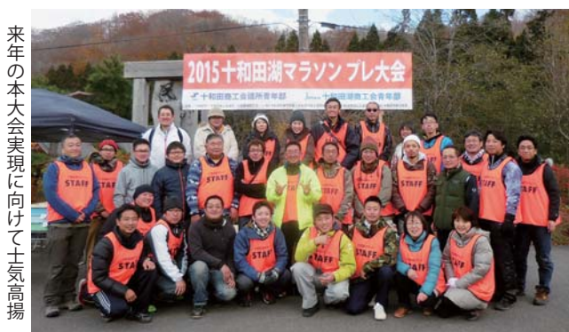
来年の本大会実現に向けて土気高揚

今回のプレ大会は事故もなく無事に終了できました。ご協力頂きました多くの関係者と青年部スタッフの皆様に、心より感謝申し上げます。