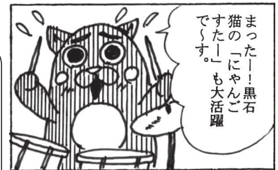
協力：のびのびマンガ教室(十和田)