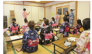
魅力UP講座。写真は「浴衣着付け講座」の様子。