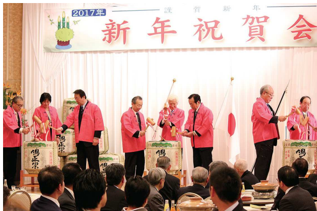
鏡開きで祝宴がスタート