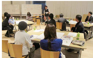
サポーターを対象に開かれた「婚活応援お役立ち講座」