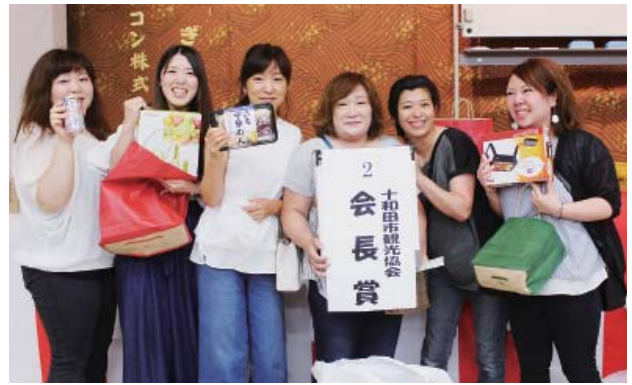
豪華景品が当たって喜びいっぱいの参加者

開催は昨年に続き今回で2回目。冬の恒例イベントとして既に29回の開催を数える「とわだ雪見ラリー」の夏バージョンとして飲食店街の活性化を図るために企画されたもので、同協会では、趣向を凝らしながら賑わいを図っていききたいとしている。