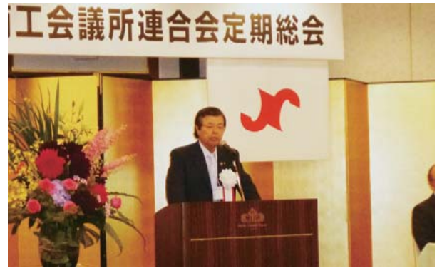
開催にあたり挨拶する鎌田東北六県連会長