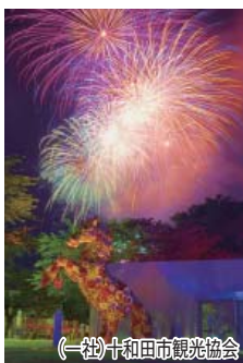
(一社)十和田市観光協会