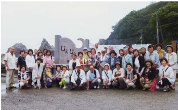
小袖海岸「じえいじえい発祥の地」記念碑の前で