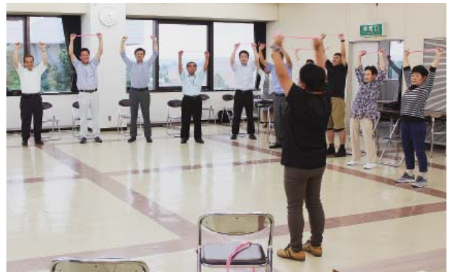
筋力向上体操で心と身体の健康づくり

また、セミナー終了後には、十和田商工会館を会場に開催された十和田納涼まつりへ参加して、参加者相互の親睦を深めた。