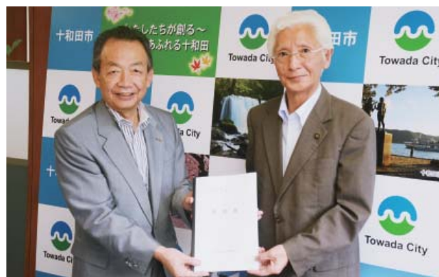
石川会頭から小山田市長へ要望書を手交

本社 十和田市大字三本木字本金崎230番地1 電話 0176(23)3536 FAX 0176(25)2976