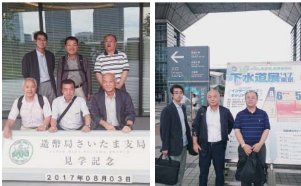
造幣局さいたま支局前(左)と下水道展前(右)で