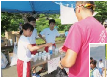
小・中学生のボランティアも