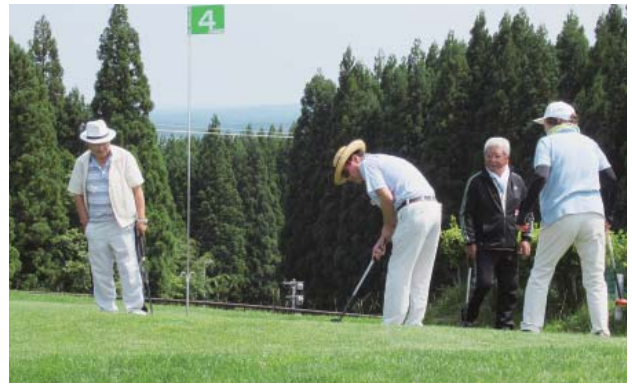
親睦を図りつつも、打つ時は真剣な表情に

1位:十和田市議会、2位:JA十和田おいらせ、3位:十和田商工会議所、4位:十和田市農業委員会