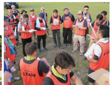
十和田湖畔を疾走！